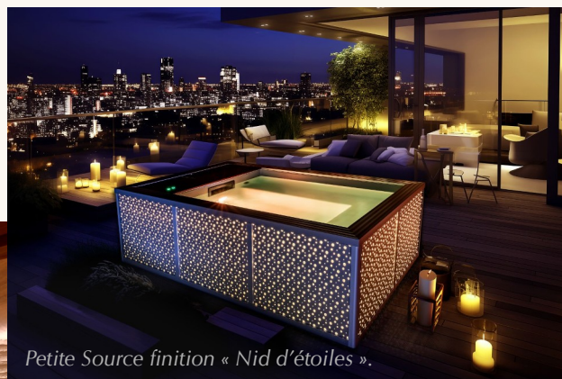
Petite Source finition « Nid d'étoiles ».

Dès la conception de votre projet, l'esprit est apaisé.