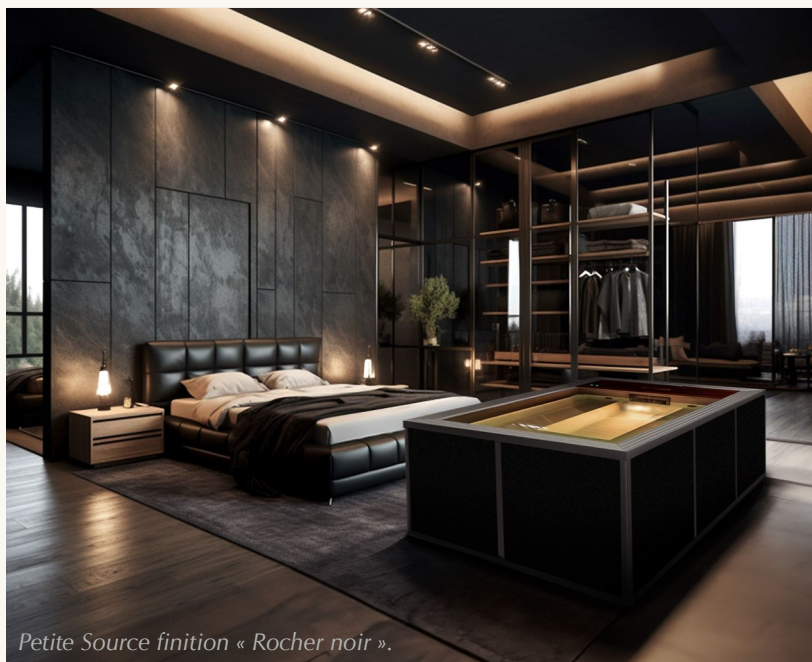
Petite Source finition « Rocher noir ».

Jardin, toit-terrasse, cour intérieure, échoppe, appentis, péniche, loft, sous-sol, véranda, suite, salon, serre, salle de sport, espace de bien-être... L'imagination est la seule limite.