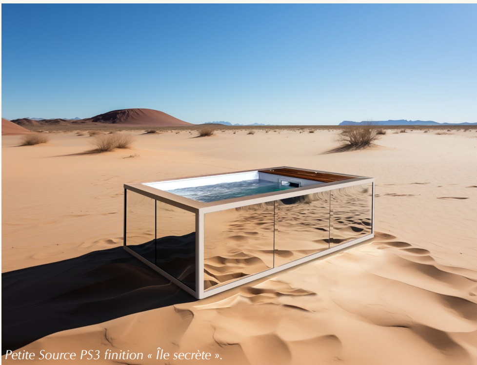
Petite Source PS3 finition « Île secrète ».

PETITE SOURCE est l'eau qui nous donne de l'énergie et du calme à la fois. Elle est vie et pureté, un milieu primordial nécessaire au corps et à l'esprit. Petite Source est un élément d'équilibre.