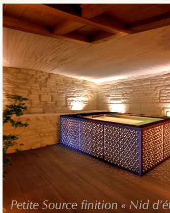
Petite Source finition « Nid d'étoiles ».

Jardin, toit-terrasse, cour intérieure, échoppe, appentis, péniche, loft, sous-sol, véranda, suite, salon, serre, salle de sport, espace de bien-être... L'imagination est la seule limite.