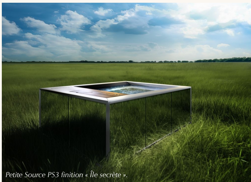
Petite Source PS3 finition « Île secrète ».