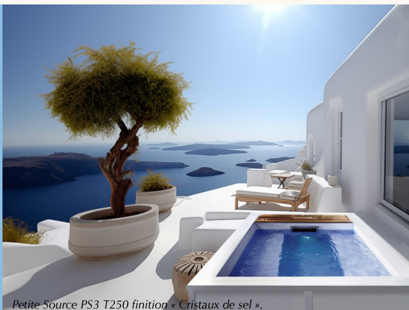
Petite Source PS3 T250 finition « Cristaux de sel ».

PETITE SOURCE chérit l'eau, et en est responsable. C'est pour cela qu'elle n'a besoin que de 0,7 à 3 mètres cube pour se remplir et durer aussi longtemps que vous le voudrez. Car PETITE SOURCE prend soin de l'eau en la traitant avec raison. Pas de consommation excessive : PETITE SOURCE peut même se remplir d'eau de pluie si vous le souhaitez. Pas de gadgets bruyants et bouillonnants ou d'appareils techniques inutiles : un filtre à cartouche garantit la qualité de l'eau en permanence, de telle manière que vous pouvez en profiter quand vous le souhaitez. L'eau n'en demande pas plus, l'esprit non plus.